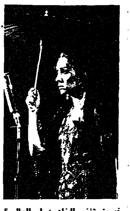
فيروز تغني للبنان ، أم للعالم ؟

والام ان الرحبانيين ككلمة «البن» اللبانية «المكر» كانا لا يزالان خارج العلاقات التجارية (وكانت الراسمالية اللبنانية لا زالت تحير) ، ونجحنا انذاك